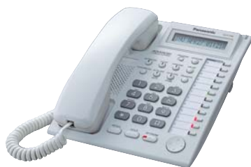
■ KX-T7730 Telefono Proprietario

* È richiesta una scheda opzionale. Contattate il vostro rivenditore di fiducia o la compagnia telefonica per avere la conferma che il servizio Caller ID sia disponibile nella vostra zona.